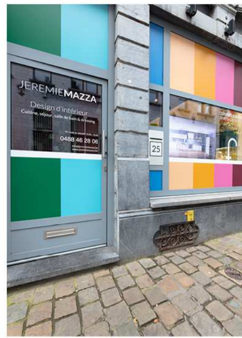
JÉRÉMIE MAZZA TOMISH DESIGN / Rue de Nimy, 25