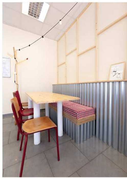
CASSE-CROÛTE DU LIDO SPATIONAUTE DESIGN /Rue de Nimy, 120