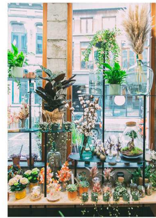
LABEYE VIR'AU VERT AEQUO /Rue du Hautbois, 16