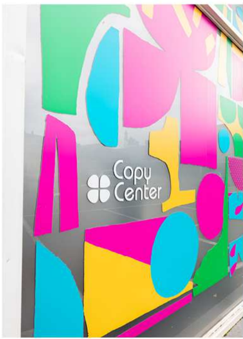
COPY CENTER KYLAB /Rue de Nimy, 143