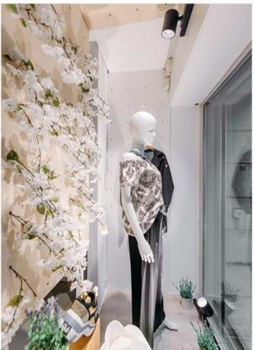
MA SŒUR ET MOI PRESENT IT /Rue de la Coupe, 18