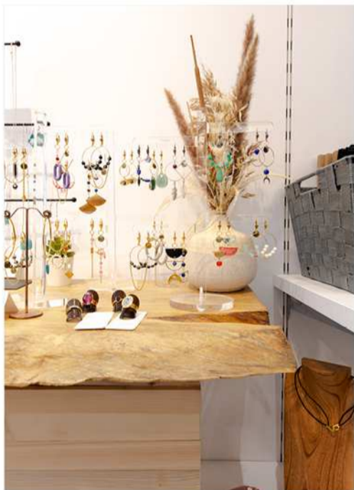
BOHO SPATIONAUTE DESIGN /Rue de la Coupe, 14