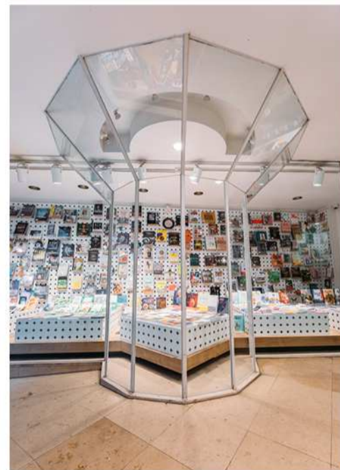
SCIENTIA VIRABIAN /Rue de la Chaussée, 64-66