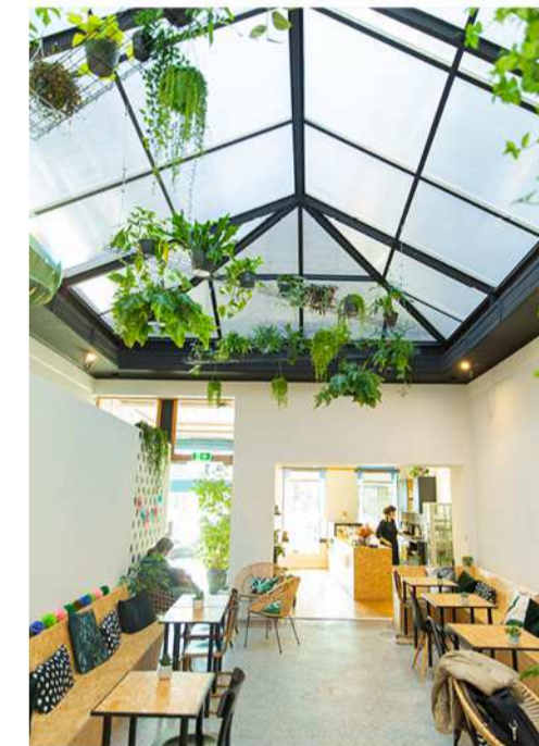
MEL OH CAKE DIANE BARBIER /Rue des Fripiers, 11