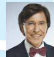
Elio DI RUPO Bourgmestre Ministre d'État