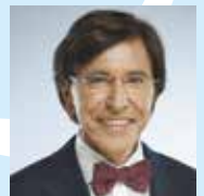
Elio DI RUPO Bourgmestre Ministre d'État