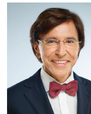
Elio Di Rupo, Bourgmestre, Ministre d'état